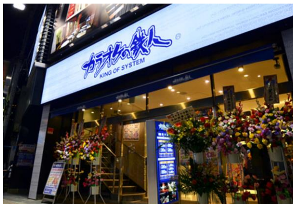
「エアトリポスター」を店頭付近に掲示

また、毎月抽選で"ペア国内航空券"があたる「エアトリ×カラオケの鉄人 ハッシュタグキャンペーン」の実施を予定しております。