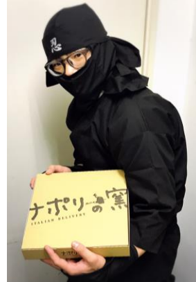
民泊施設配達時の忍者ユニフォーム